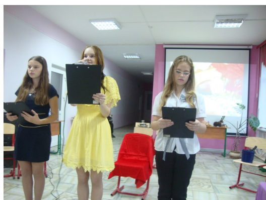
Ведущие осеннего бала