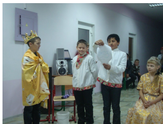
Сценка 6 класса