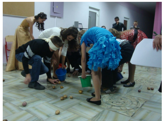
Конкурс "Собираем урожай"