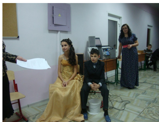
Осенняя пара 7 класса