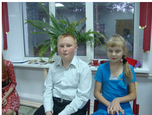
Осенняя пара 6 класса