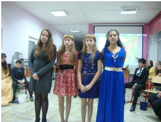
Выступление 8 класса