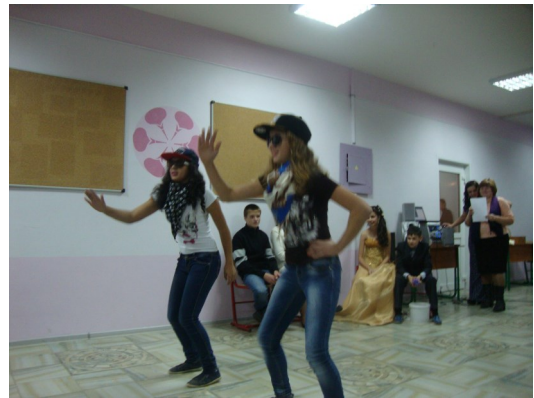
Выступление 7 класса