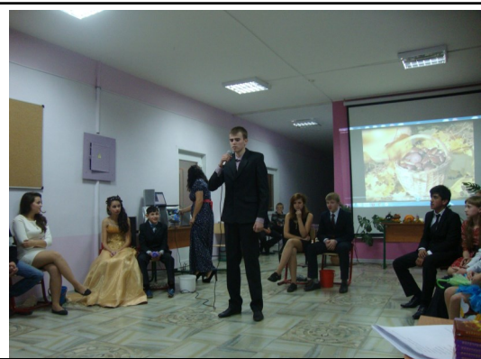
Выступление 11 класса