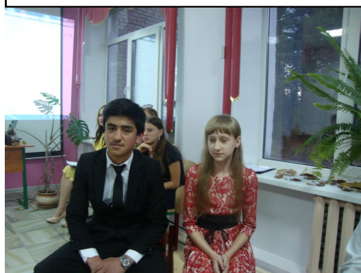
Осенняя пара 8 класса