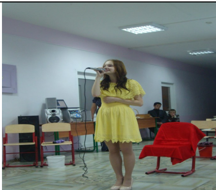
Выступление 9 класс