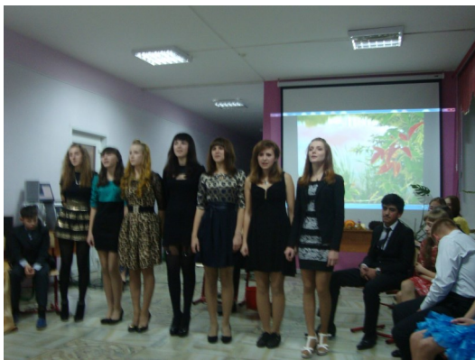
Выступление 10 класса