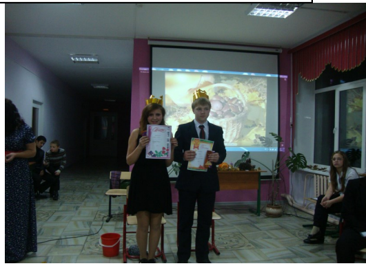
Король и королева Осеннего бала