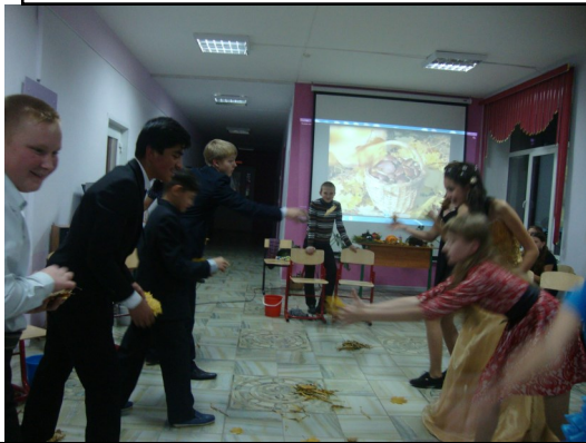
Конкурс "Поймай осенний листок"