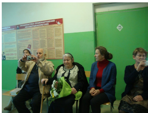
Вдова поэта и родственники