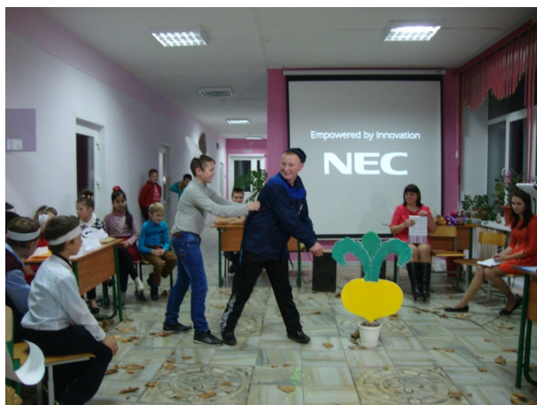
Репка на новый лад