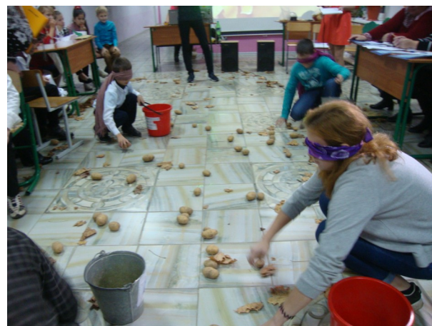
Ловкость рук и никакого мошенничества.