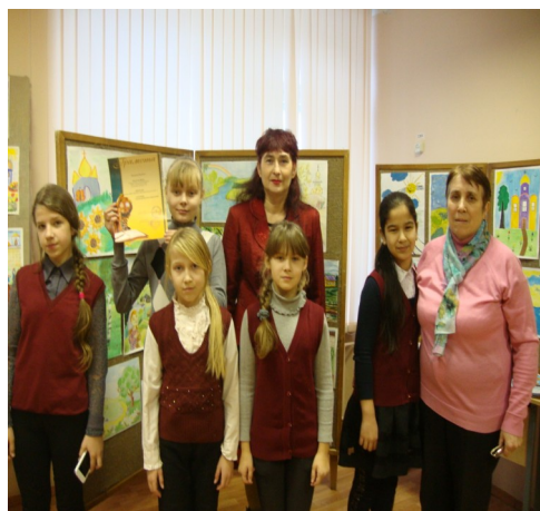
На вручении грамоты.