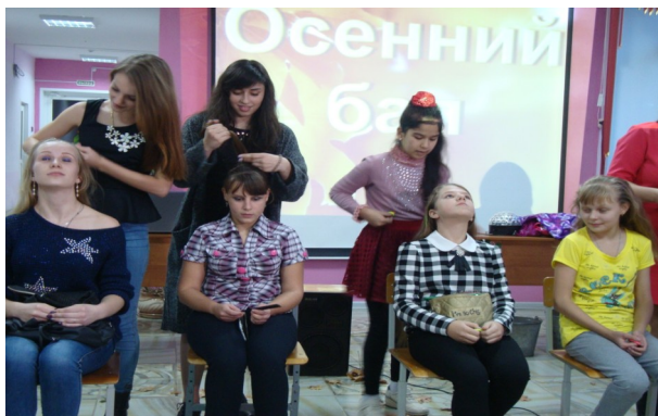
Красивой быть не запретишь