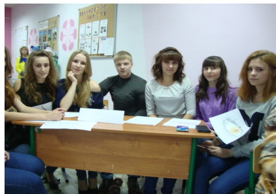
Они были первыми