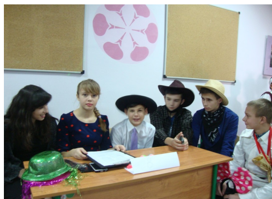
Дон Педро и его окружение